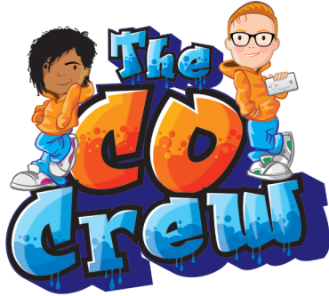
نشر التوعية حول غاز أول أكسيد الكربون

تعرف على البطل الخارق Safety Seymour، قائدا الهام! تتمثل مهمة البطل الخارق Safety Seymour في تعليم أطفال المرحلة الأساسية 1 (الصفين 2 و 3) كل شيء عن كيفية الحفاظ على أنفسهم في مأمن من غاز أول أكسيد الكربون.